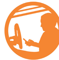
O uso do celular na direção