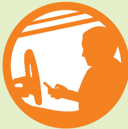
O uso do celular na direção